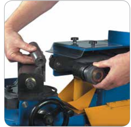
Sistema de rodillo para cambio rápido patentado