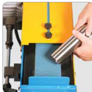
Superficie de desbarbado