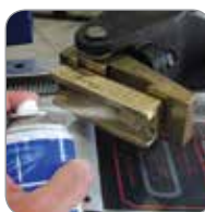
Atomizador de lubricante