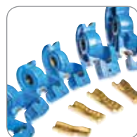
Estuche de herramientas para tubo y tubería