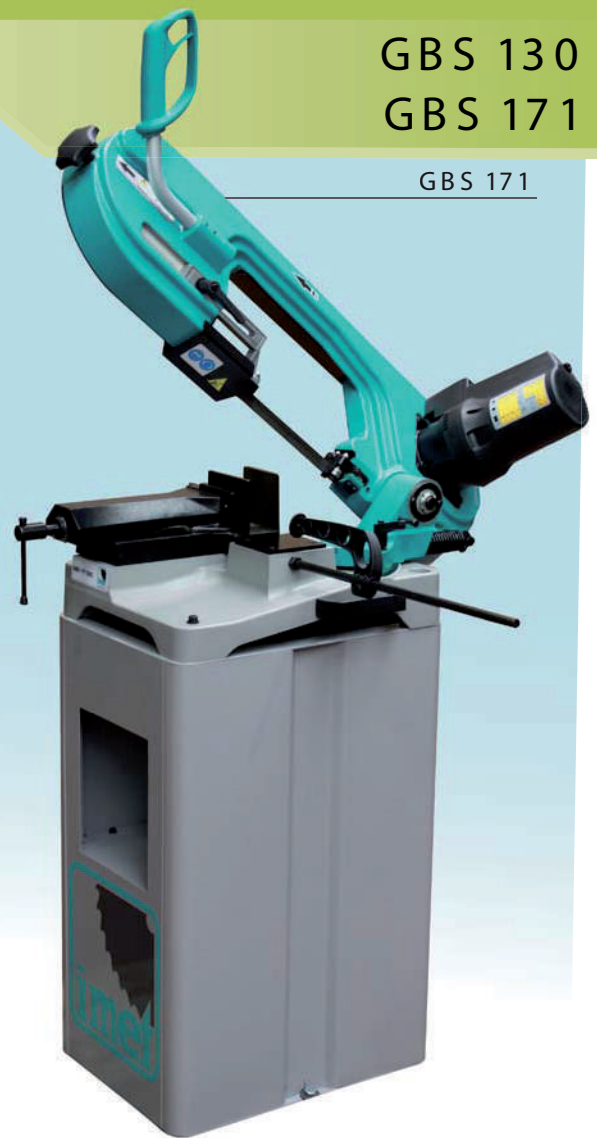
GBS 130 - SCHEDA TECNICA - TECHNICAL FEATURES

Motor de altas prestaciones 220v monofasica con regulación electrónica de la velocidad de la hoja, doble protección contra sobrecalentamiento y sobrecarga de corriente.