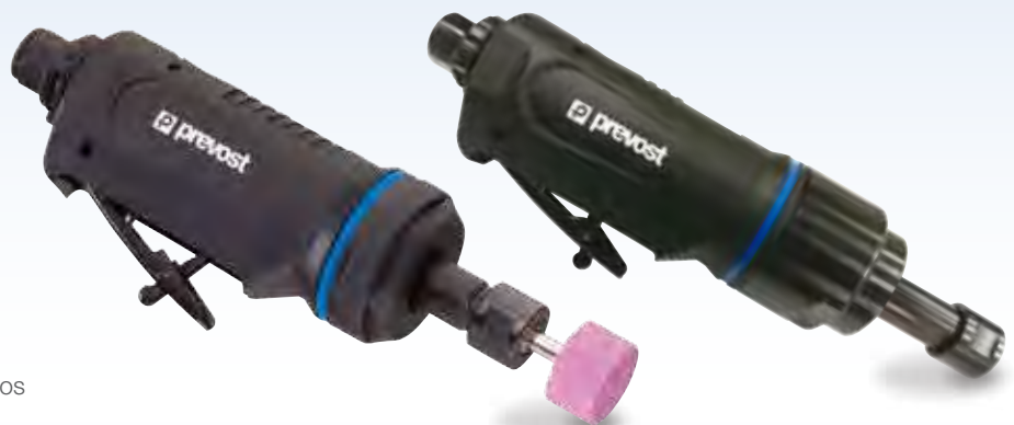
TDG S22000 (muela opcional)

TDG S22000: trabajos de amolado, fresado, decapado y desbarbado. TDG S04000: trabajos de tronzado, amolado, fresado, decapado y desbarbado. Velocidad reducida para evitar el calentamiento.