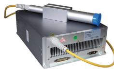
Generador Láser Raycus