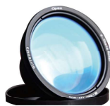
Lente de grabado