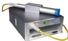
Generador Láser Raycus