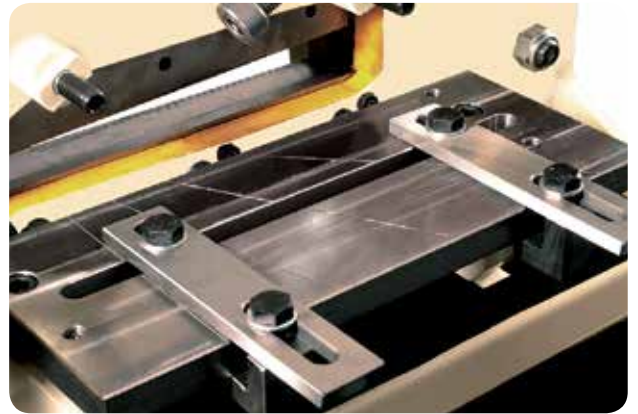
3 Con el objetivo de eliminar las deformaciones permanentes que se producen en el material en el momento del corte, la serie BENDICROP está dotada, de forma exclusiva, de un SISTEMA DE CORTE DE LLANTAS SIN DEFORMACIÓN. Este sistema está especialmente diseñado para cortar materiales blandos (cobre, aluminio...) obteniendo calidades de corte excepcionales.