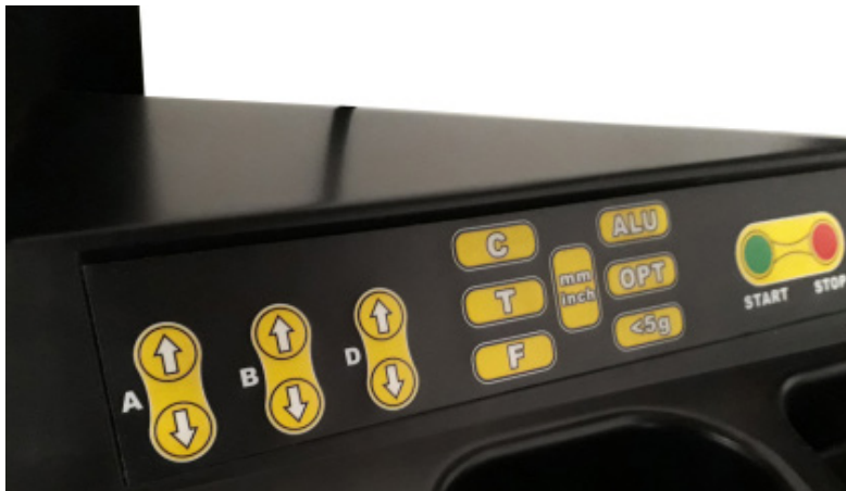
Panel de control