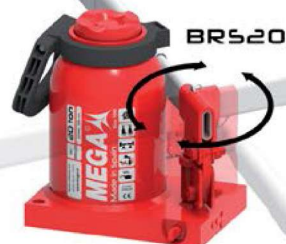
Palanca giratoria accesible en cualquier posición

Con las mismas ventajas técnicas que las de los gatos BR, aunque diseñados para aplicaciones especiales. Los modelos BRS se caracterizan por su menor altura mínima para acceder a espacios reducidos o, a la inversa, en el caso de los modelos BR2L.