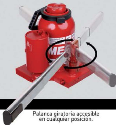
Palanca giratoria accesible en cualquier posición.

Todos los modelos tienen husillo de aproximación rápida a la carga, bomba neumática de alto rendimiento con accionamiento a distancia, y pistón nitrurado en baño de sales que asegura una larga vida útil.